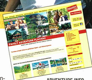
ADVENTURE.INFO. Das Angebot von 18 Beherbergungsbetrieben wird online einfach im Paket verkauft.

chen. Das Angebot ist so übersichtlich präsentiert wie beim All-inclusive-Cluburlaub – im Hintergrund werden die Anfragen automatisch an die 18 teilnehmenden Flachauer Betriebe verteilt. Vier-Sterne-Häuser sind ebenso dabei wie Bauernhöfe. Einheitliche Planung hat den Vorteil, dass die Kapazitäten, etwa Animatoure, gebündelt werden können. Projektmanager Weitgasser: „Über die Plattform wurden 15.000 zusätzliche Nächtigungen generiert.“